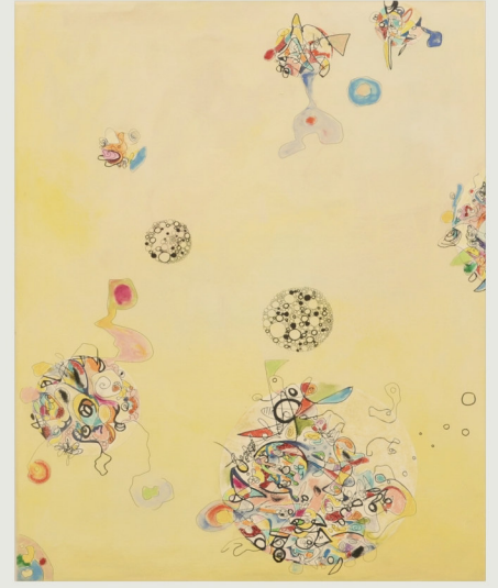
o.T., Mischtechnik auf LW, 2016, 80 cm x 60 cm