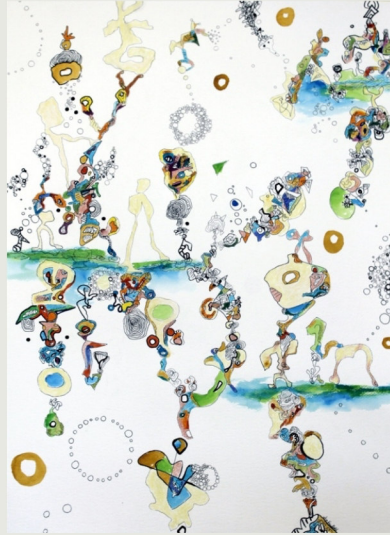
o.T., Bunt-Tuschestift u. Aquarell- farbe, 2016, 76 cm x 56 cm