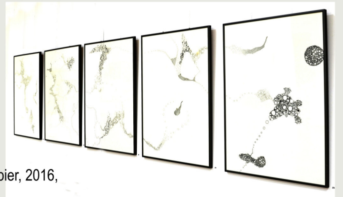
o.T., fünf Zeichnungen, Tuschestift auf Aquarellpapier, 2016, je 70 cm x 50 cm