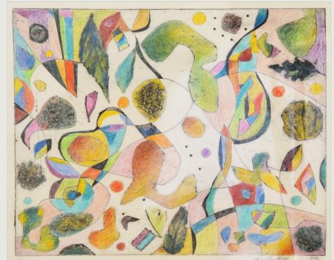
Drei colorierte Druckgrafiken, 2015/2016, je 22 cm x 27 cm