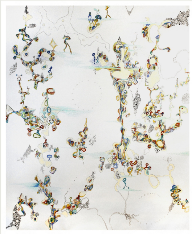
o.T., Bunt- u. Tuschestift auf Papier, 2016, 180 cm x 150 cm