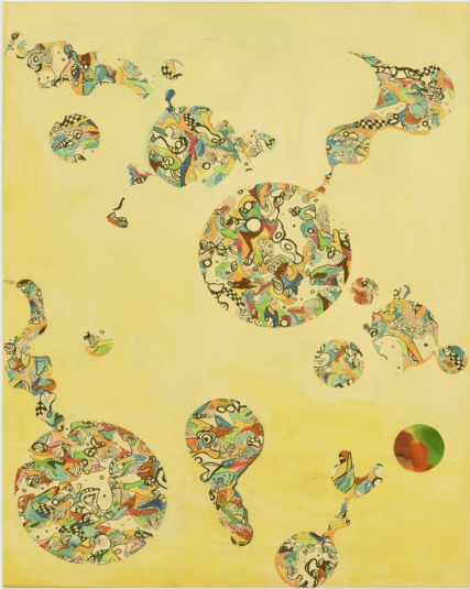
o.T., Mischtechnik auf LW, 2015 80 cm x 60 cm