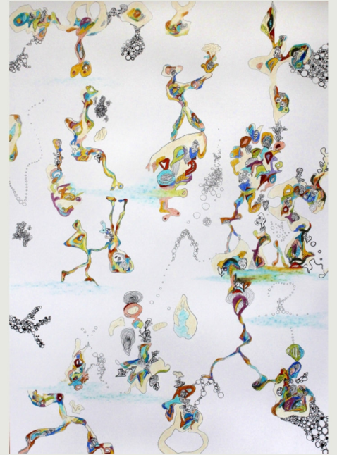
o.T., Bunt- u. Tuschestift auf Papier, 2016 100 cm x 70 cm